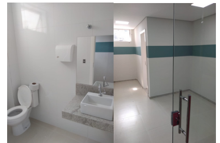
Reforma do quarto de descanso dos funcionários do Pronto Atendimento

Participe das nossas campanhas Você também!